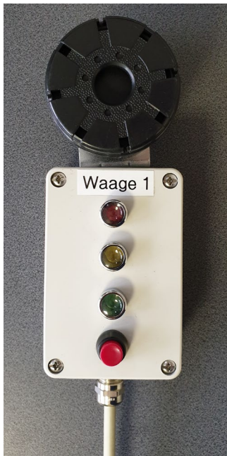
Signalbox 4 Funktionen Ampelschaltung Signalhorn abschaltbar