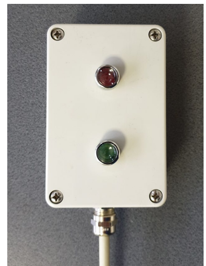
Signalbox 2 Funktionen