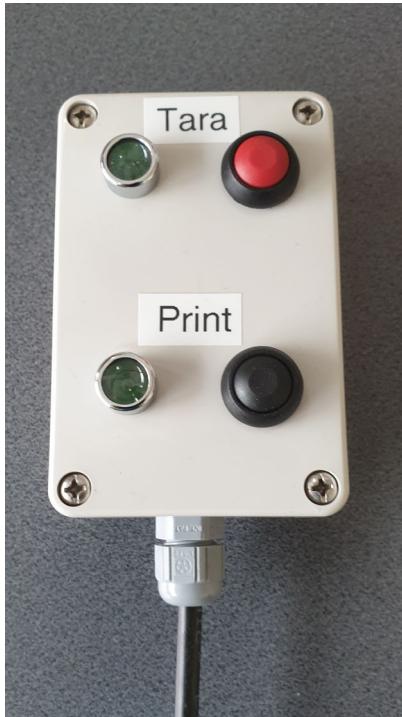
Bedienbox 4 Funktionen Tariieren/Netto 0, Drucken/Druckkontrolle