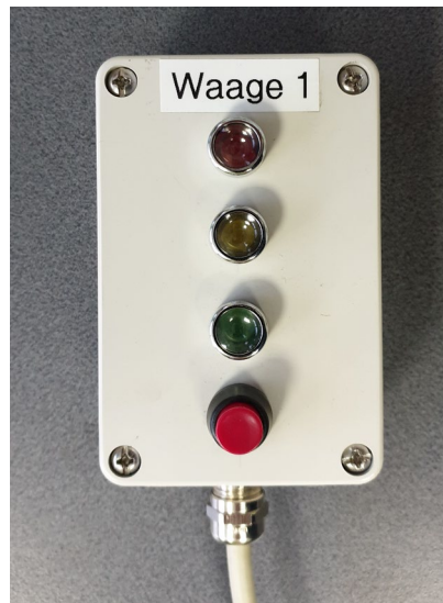
Signalbox 4 Funktionen Ampelschaltung