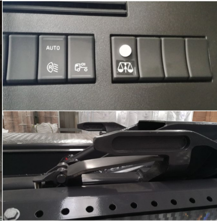
Freigabe zur Wägung Transportsicherung