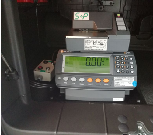
Wägeelektronik mit Drucker im Staufach