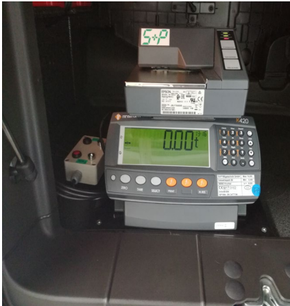
Wägeelektronik mit Drucker im Staufach